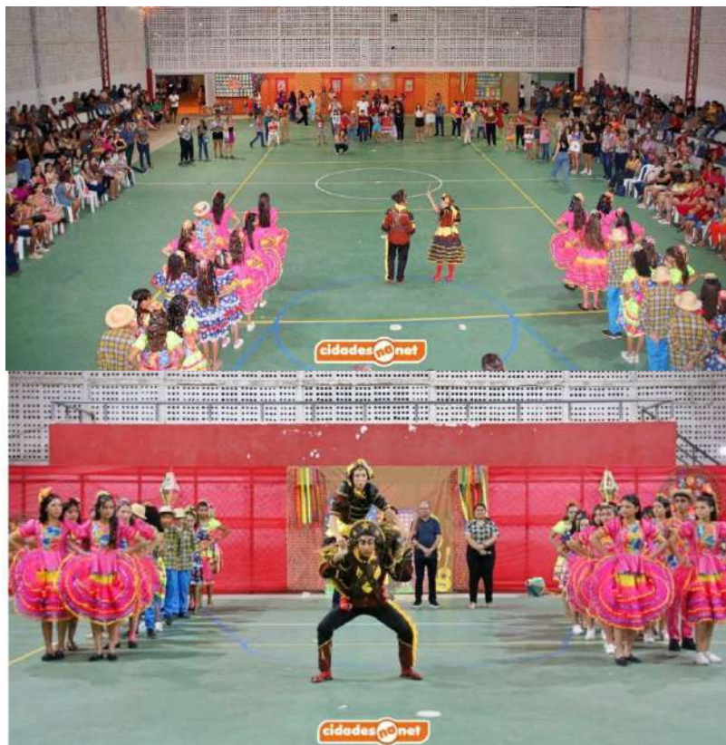
Celebra cultura e encerra semestre com belas apresentações