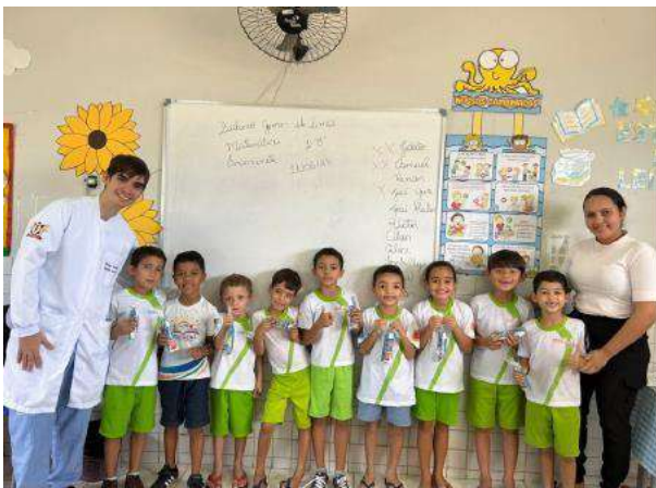
A ação contemplou atividades educativas sobre higiene bucal, aplicação tópica de flúor e a distribuição de kits contendo escova, creme dental e fio dental para os alunos.